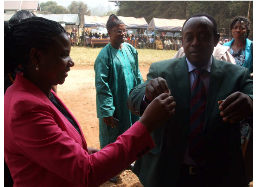
Die Bibliothek ist offizielle eröffnet mit Schlüsselübergabe an den Bürgermeister.