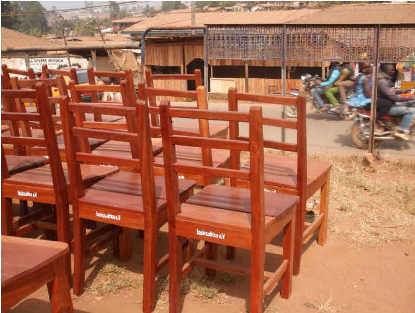
Stühle und Tische für Makong Library werden beim Hersteller beschriftet.