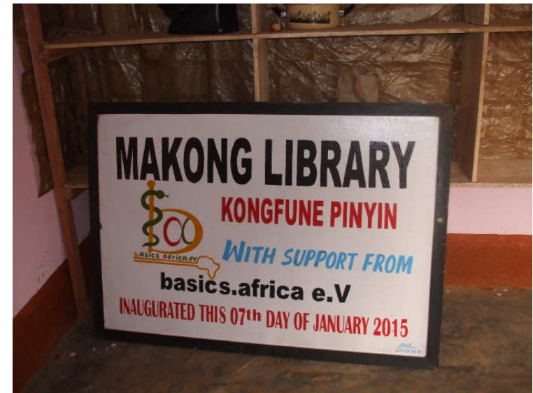
Das Schild mit der Beschriftung stehen zu anbringen bereit.