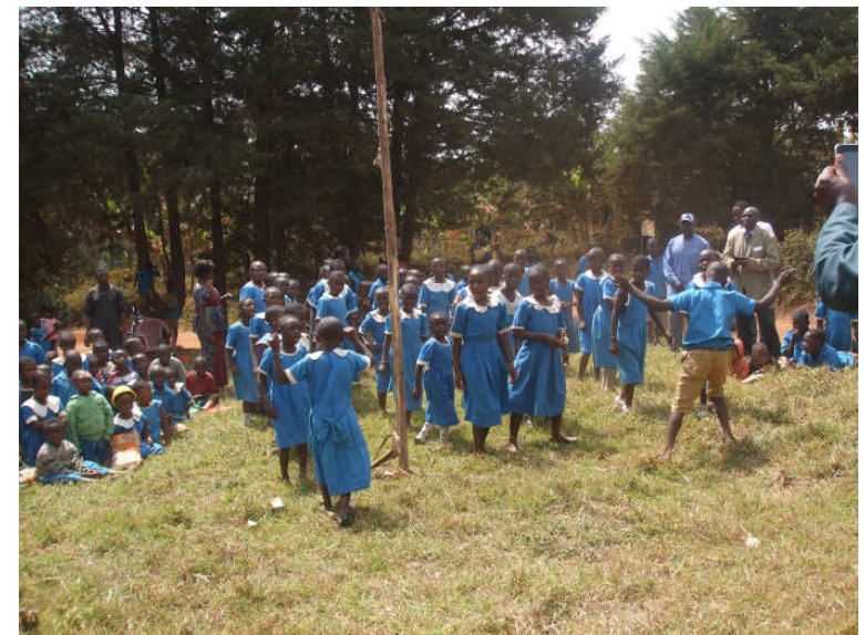
Schulchor in Aktion!!