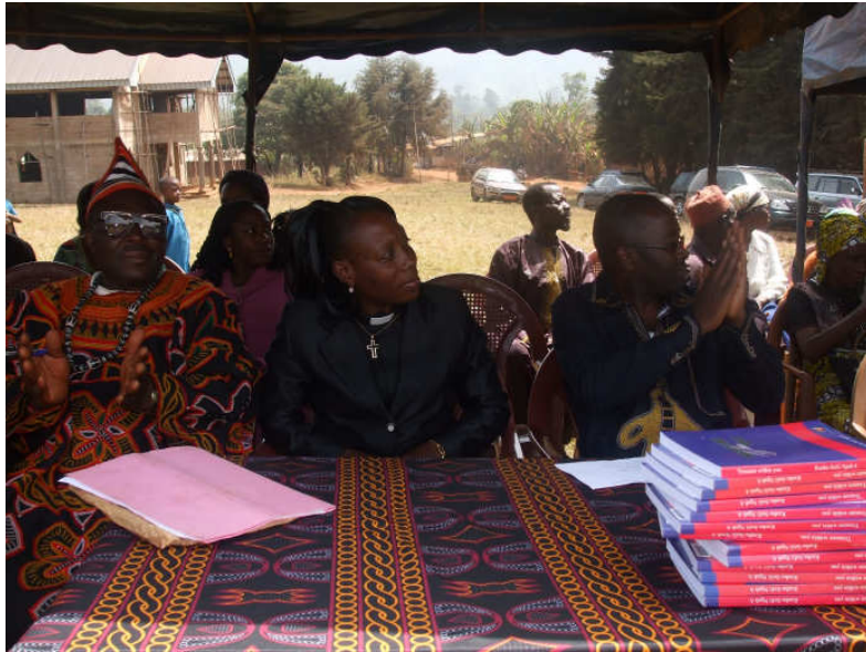
Am Tag der Einweihung: Schulleternbeirat, Pastorin, Pfarrer