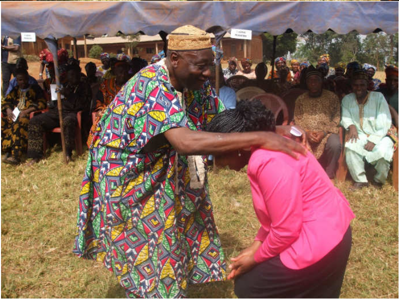
Segnung durch den Vertreter des Häuptlings