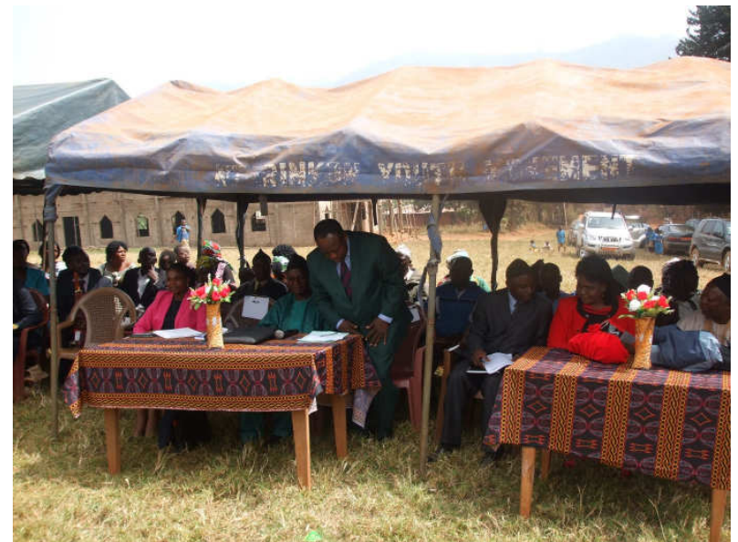
Der Bürgermeister ist endlich auch angekommen.