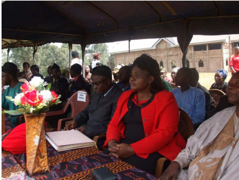
Die Vertreterin der Bildungsministerin, die „Regional Delegate of Basic Education North West“ ist auch angekommen.