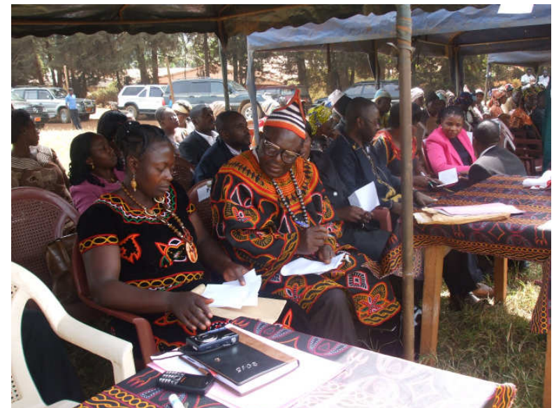
Veranstaltung läuft, Schuldirektorin neben dem Elternbeirat, Ich ganz rechts mit der pinken Jacke