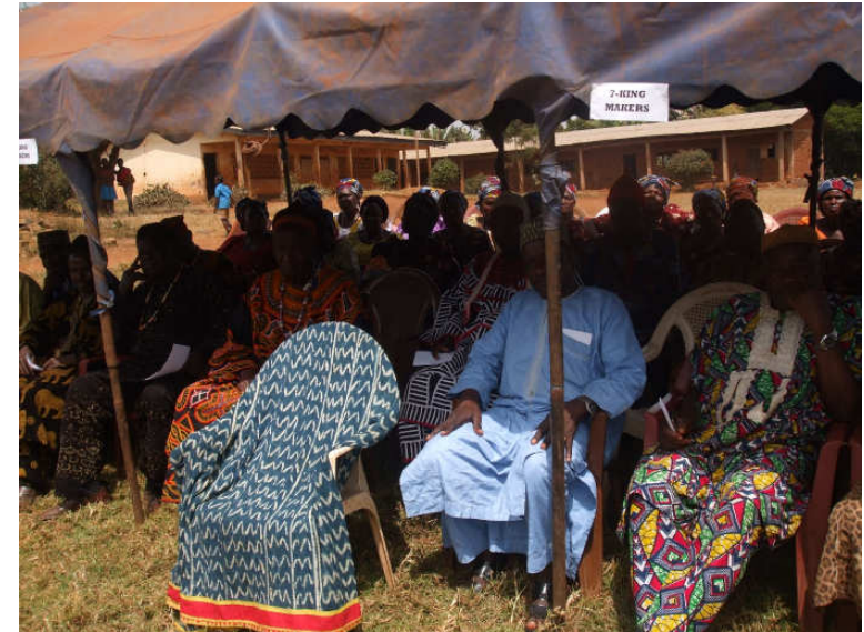
Sitz des Oberhäuptlings ist leer, da er im Krankenhaus liegt, 2. Schlaganfall.