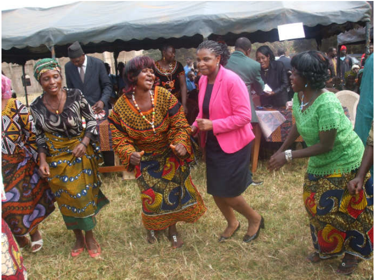
Unterhaltung mit Damen Tanzgruppen