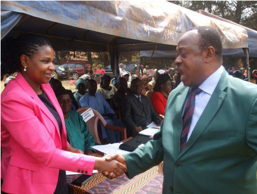
Der Bürgermeister nach seiner Rede bedankt sich bei mir für die wundervolle Arbeit