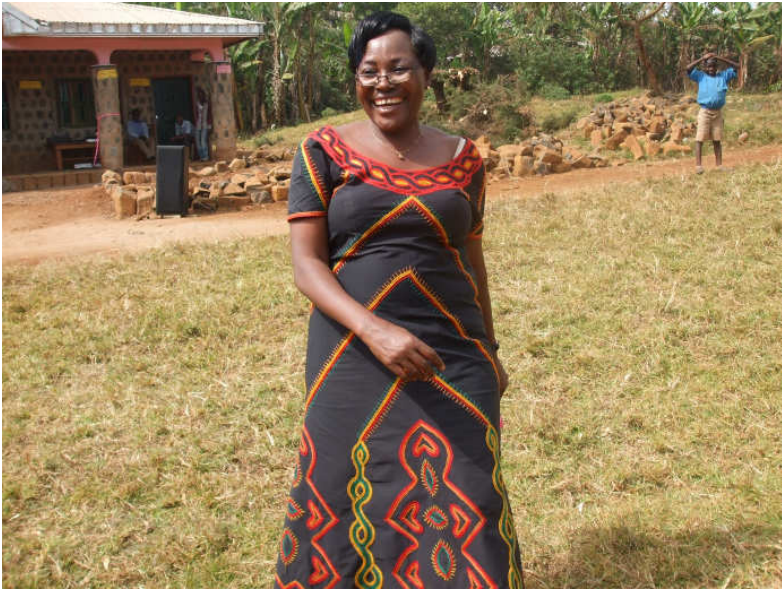
Die Moderatorin und Journalistin