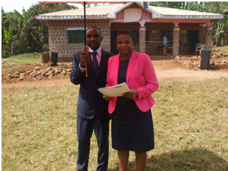
Meine Rede: Unterm Sonnenschirm.