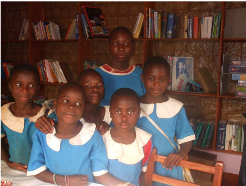
Nach langem Warten können die Schüler endlich die Bücher anfassen. Die Freude war groß.