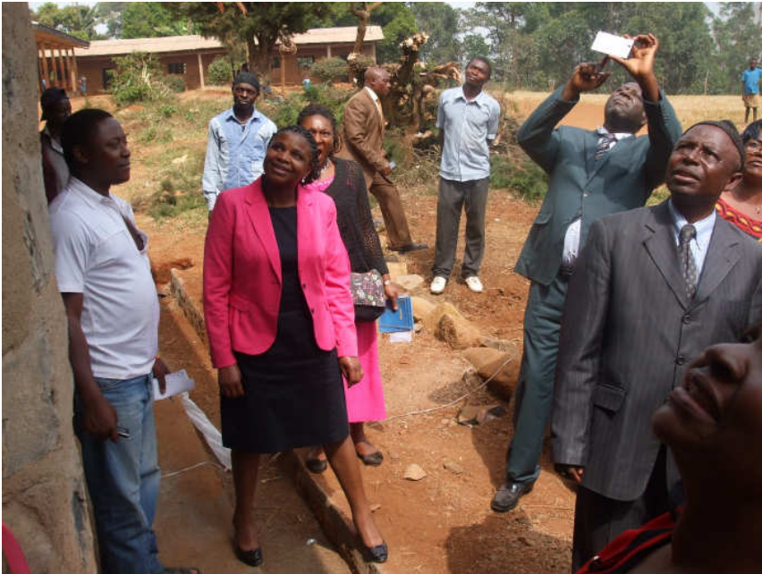
Das Namensschild wird veröffentlicht, alle sind gespannt auf den Namen.