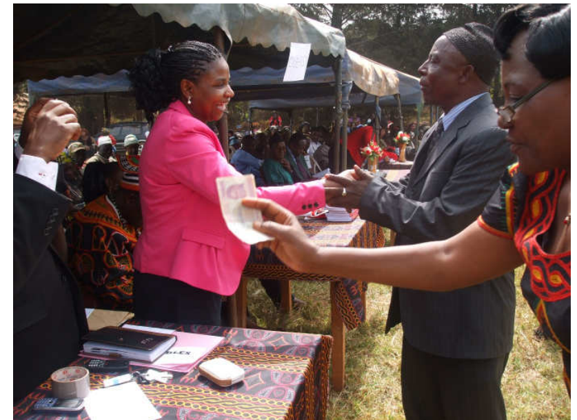
Zeit für Spenden