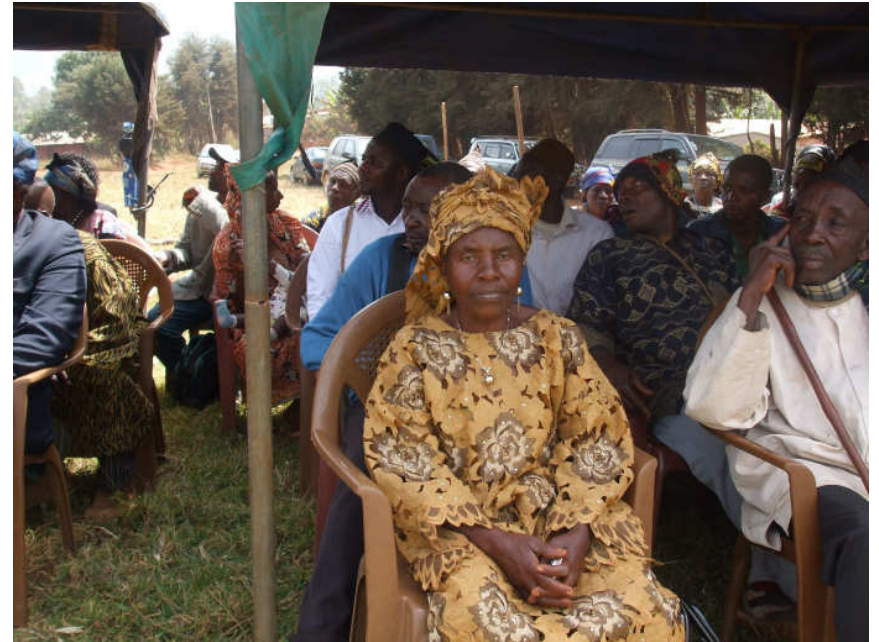
Die Lehrerin, die mir das Lesen mit 7 Jahren vor 37 Jahren beigebracht hatte.