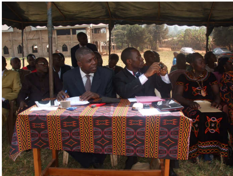
Teil der Organisationmannschaft