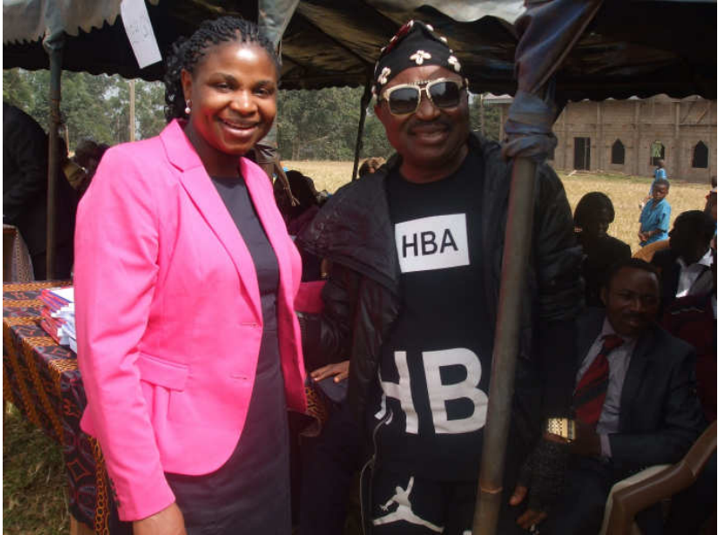
Der höchste Spender des Tages